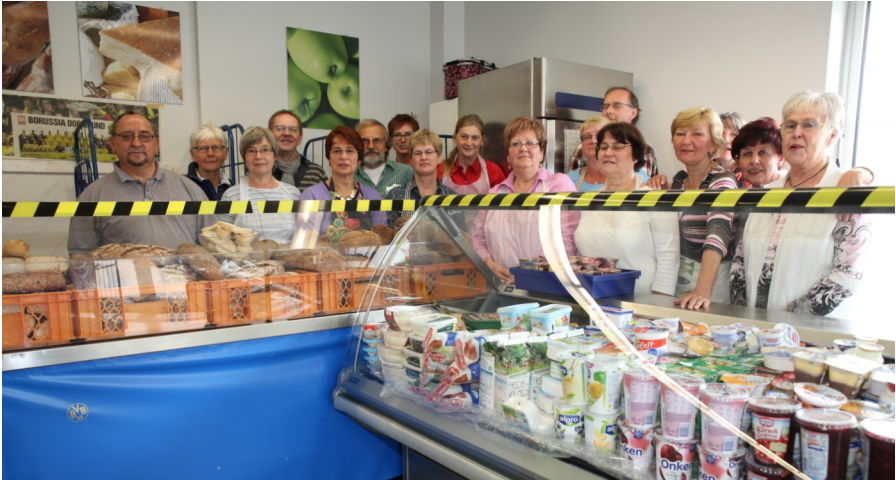
Das Team der Dortmunder Tafel in Scharnhorst