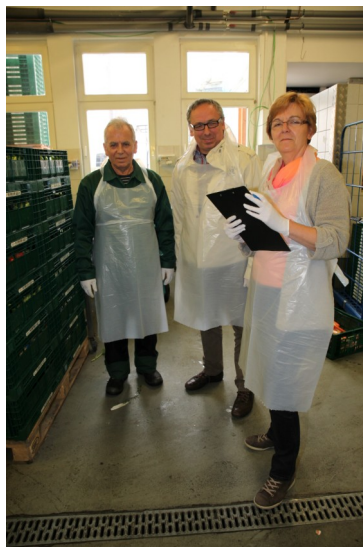
Hygiene-Überprüfung im Lager

Wer Fragen und Anregungen bezüglich der Tafel-Hygiene hat, ist herzlich eingeladen diese mündlich oder per eMail an das Hygiene-Team zu richten hygiene@dortmunder-tafel.de JF