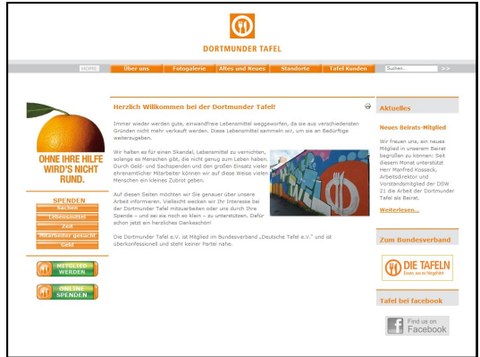
Die Homepage der Dortmunder Tafel

YouTube ist ein Videoportal des US-amerikanischen Unternehmens Google. Die Benutzer können auf dem Portal kostenlos Video-Clips ansehen, bewerten und selber hochladen.